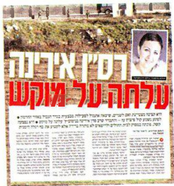
“ידיעות אחרונות”, פברואר 2015: דיווח על הפציעה