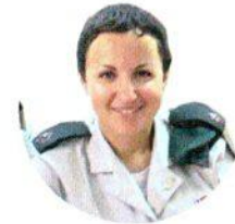
"נשארת אותה אירה בדיוק". לפני הפציעה

כשבגרה שמעה מחברותיה ללימודים על פרויקט נעל"ה (נוער עולה לפני ההורים). "החלטתי ללכת, כי לטוס לחו"ל נשמע לי כמו חלום. ההורים לא האמינו שאעבור את הבחינות, משום שבאותה תקופה לא ידעתי כמעט כלום על ישראל. ידעתי רק שאני יהודייה, אבל זה הכל. עד שהגעתי ארצה לא שמעתי אפילו את המילה אנטישמיות."