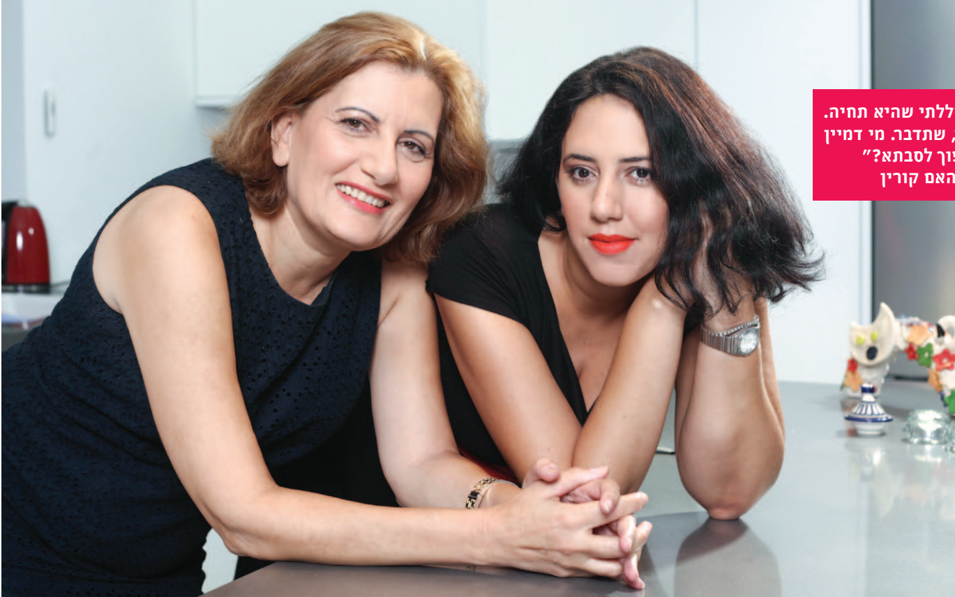
איפור: סנטלה קריחלי

”התפללתי שהיא תחיה. שתלך, שתדבר. מי דמיין שאהפוך לסבתא?” שרי והאם קורין